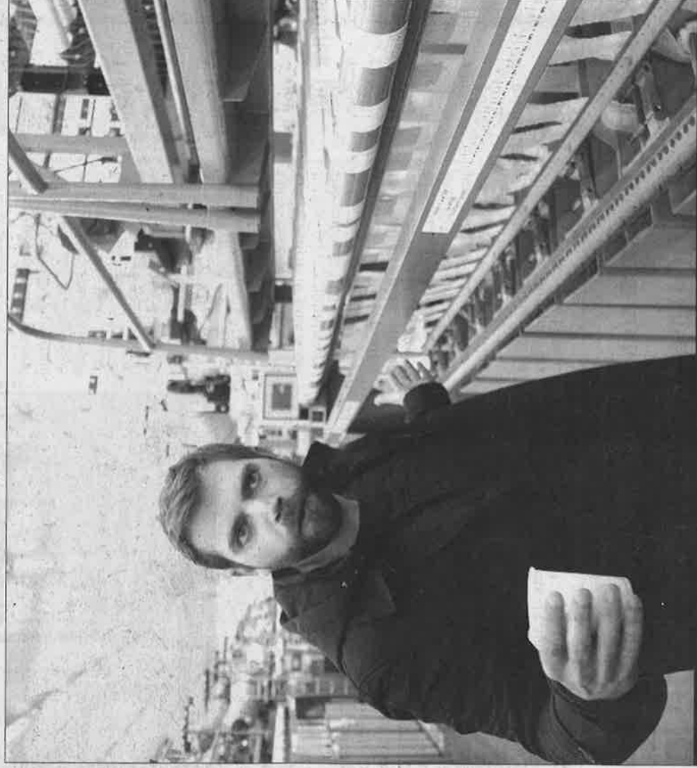
ENTREPRISE. L'artiste va rester au sein de l'entreprise Fontanille pour réaliser son œuvre.

Contacté par HS Projets, l'artiste s'intègre dans la septième édition du Festival international des textiles extraordinaires (Fite) qui a pour but de favoriser les échanges d'idées, de savoir-faire entre l'art et l'industrie. Souhaitant constituer une œuvre monumentale représentant un corail, il entre en contact avec la Scop Fontanille. C'est à ce mo-