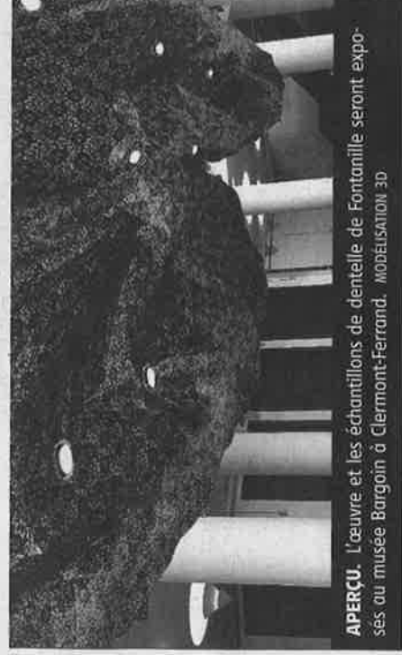
APERÇU. L'œuvre et les échantillons de dentelle de Fontanille seront exposés au musée Bargoin à Clermont-Ferrand. MODÉLISATION 3D

Durant plusieurs mois, Jérémy Gobé sera au sein de la Scop Fontanille pour réaliser son œuvre monumentale. Cette dernière sera par la suite exposée au musée Bargoin de Clermont-Ferrand du 18 septembre au 31 décembre, dans le cadre du Fite et au-delà. Le corail artificiel intégrera une salle d'exposition, et gagnera la façade du bâtiment ainsi que la rue